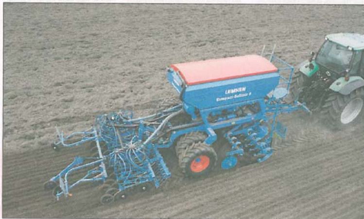
Tidlig såning af vinterhvede, vinterbyg og vintertriticale 20.-25. august giver et signifikant merudbytte sammenlignet med såning til normal tid cirka 20. september.

Ministeriet for Fødevarer, Landbrug og Fiskeri